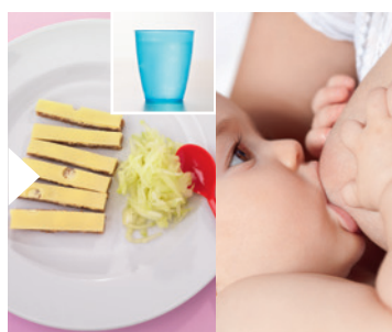
1 fetta di pane integrale + latticino* + cetriolo + piccola quantità di burro o margarina