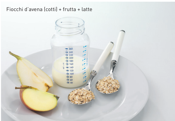
Fiocchi d'avena (cotti) + frutta + latte

Verso la fine del primo anno di vita avviene il passaggio dalle pappe alla dieta familiare.